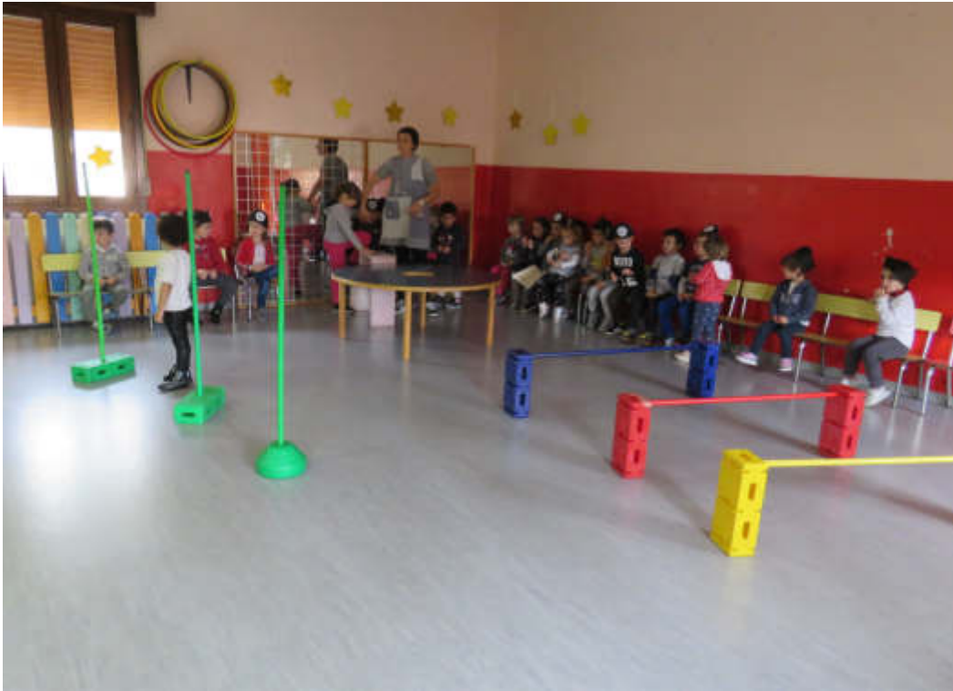
saltare in mare dal vascello e