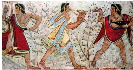
LE MAGISTRATURE ETRUSCHE

PIÙ TARDI, NELLE CITTÀ-STATO, A QUELLO DEI LUCUMONI SI COSTITUÌ UN GOVERNO OLIGARCHICO FORMATO DA MAGISTRATI. DODICI DELLE MAGGIORI CITTÀ STATO ETRUSCHE ERANO UNITE IN UNA LEGA, LA COSIDDETTA DODECAPOLI. QUESTA UNIONE, PERÒ, NON AVEVA SCOPI DIFENSIVI O DI CONQUISTA, MA SOLAMENTE RELIGIOSI.