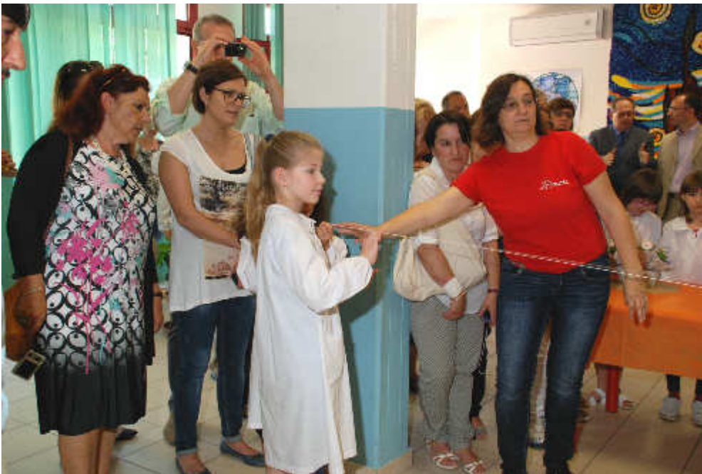
Classe quarta TERRA