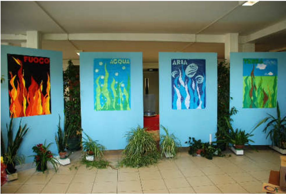
La classe prima ARIA