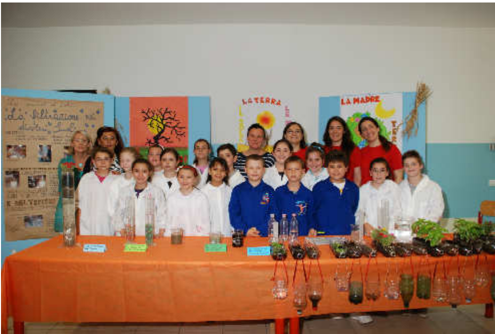
Classe quinta FUOCO