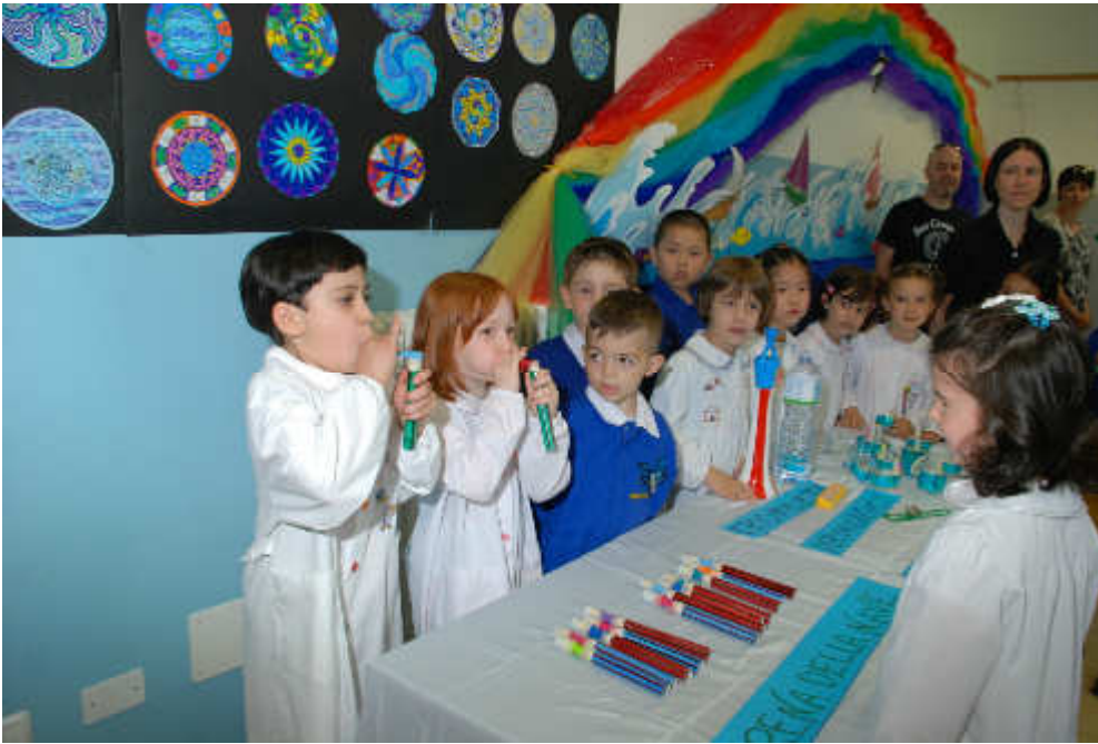
La classe seconda ACQUA